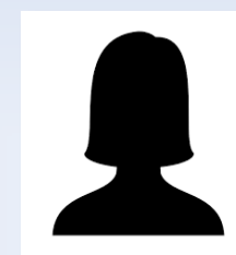
Administratrice Poste à pourvoir